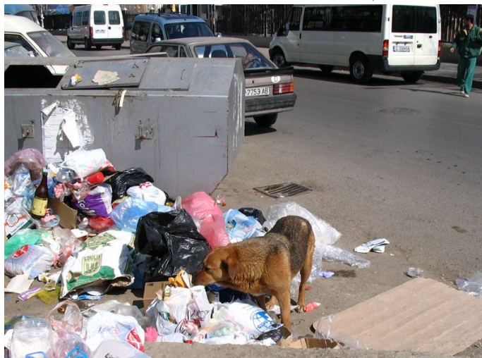
Студентски град – рай за бездомните кучета