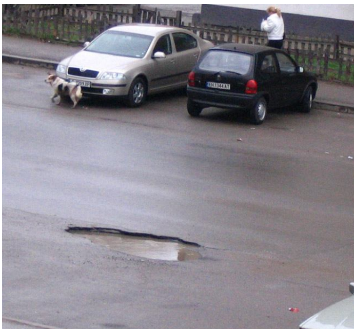
Разбитите пътища от тежкотоварните строителни машини