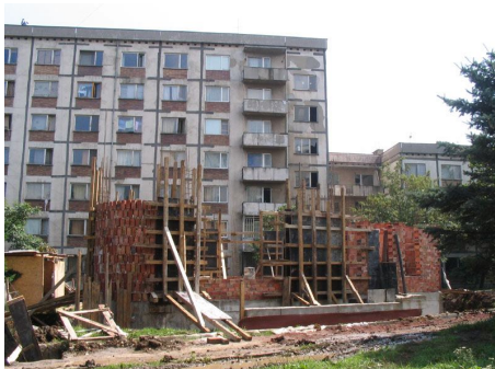
Разбитите пътеки пред общежитията