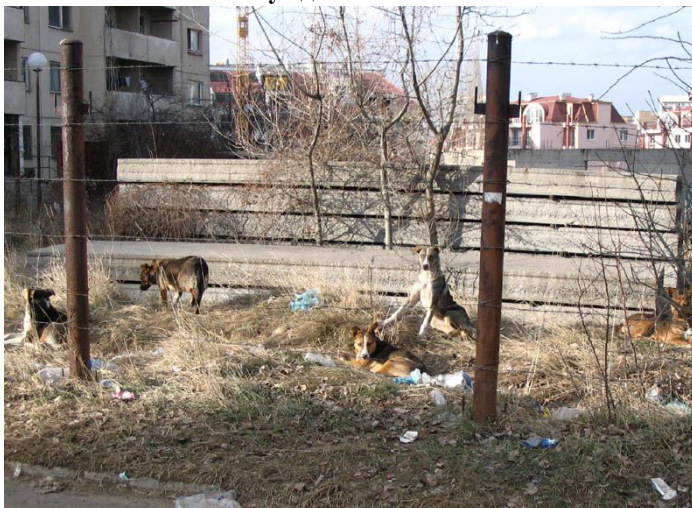
Компактна група “умерено” агресивни кучета