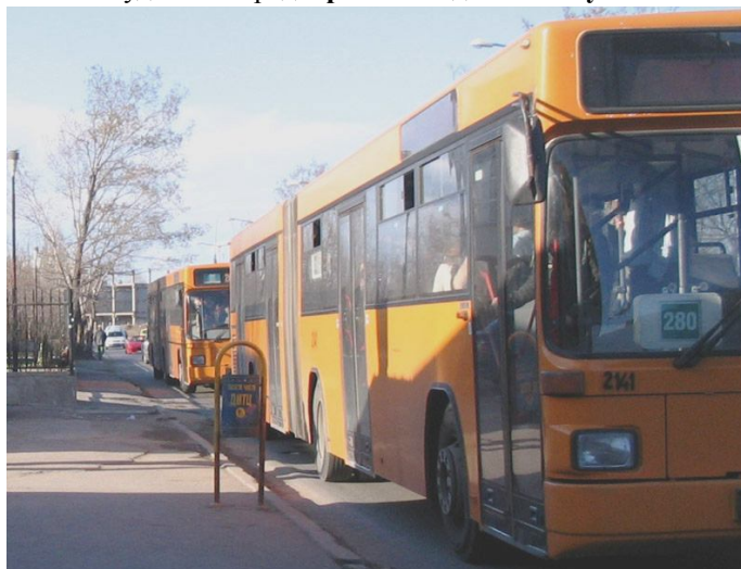
Част от автобусните композиции, с които се извозват студентите по Университетите. Снимката е правена на слизане от предния автобус.