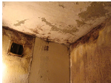
"Луксозия" таван в банята