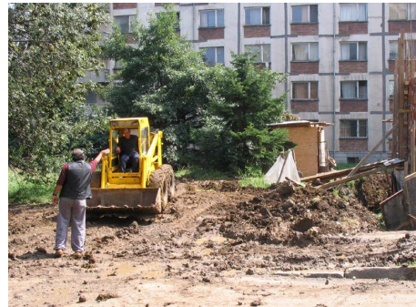
Готовия за сафари тротоар около блокове 12 и 13 в Студентски град