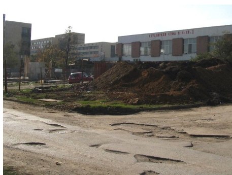
"Лунен пейзаж" пред стол №4