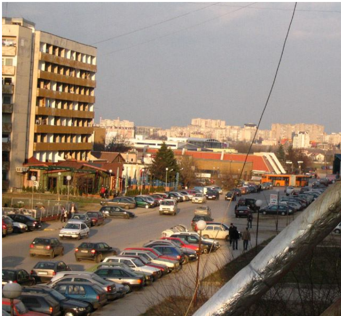
Претоварена от движение улица в Студентски град