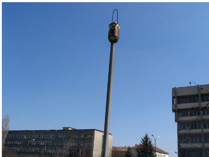
Знанието е светлина – затова пред наш Университет, осветителните тела са отживелица