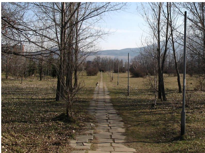
Парк “ Мир и дружба ” – толкова е дружелюбен, че явно няма нужда от осветление