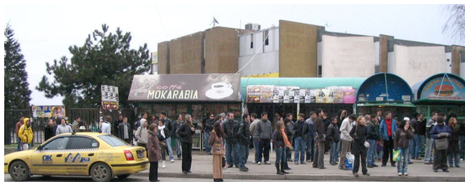
Дългото чакане за автобус на "Зимен дворец". Упражненията и лекциите чакат солидарно.