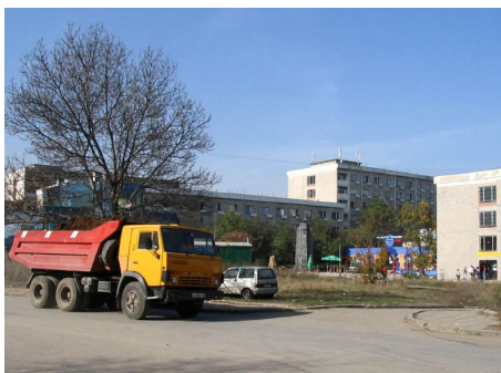
В очакване на намалените карти зад 12-ти блок