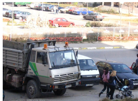
Майки с деца, заобикалящи заелия част от тротоара камион