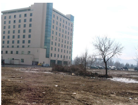
Блатата след строежа на нов хотел на в двора на голям наш Университет