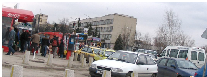
Очакване на автобус сред автомобилния хаос пред УНСС