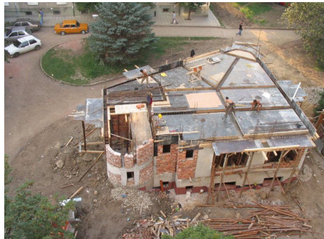
Непроходимият терен около поредния незаконен строеж