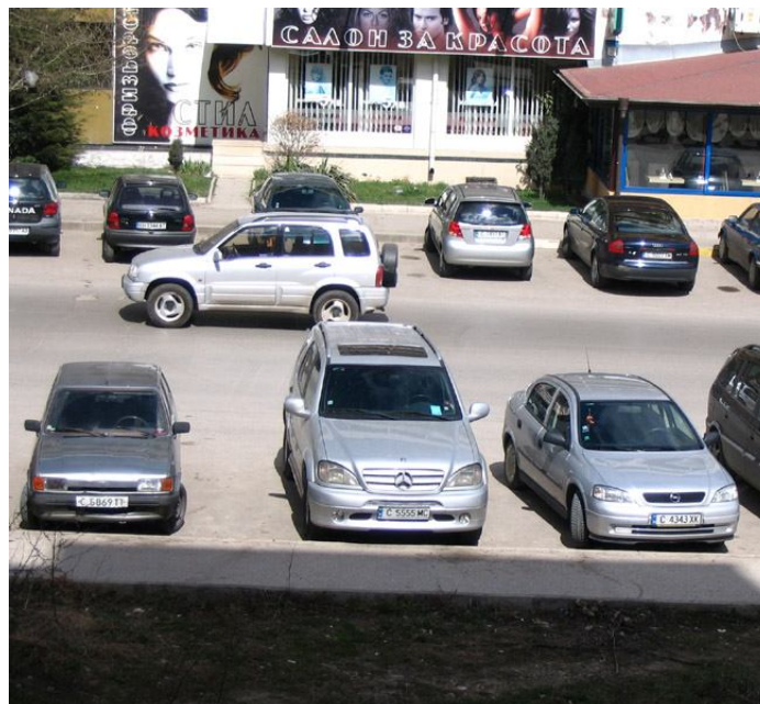
Дали има кола, която да не е със софийска регистрация в паркингите пред студентските общежития?