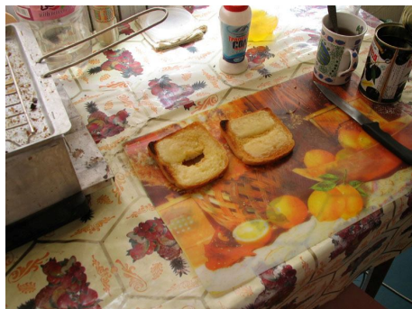
Закуската му с цена половин билет