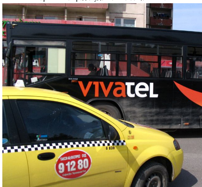
Рекламата по нашите автобуси, носеща немалка печалба