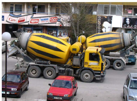
"Удобна" за пресичане уличка в Студентски град