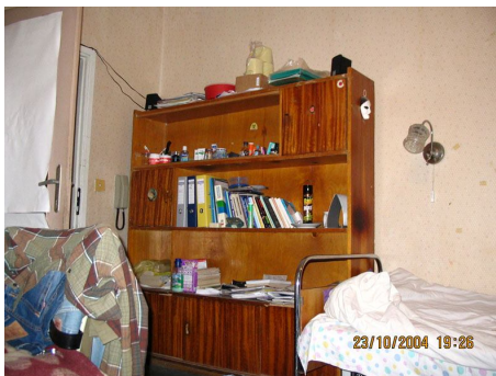
Стая от 24.48 м 2 . на "богатия" студент, споделящ я с още двама "богаташи"