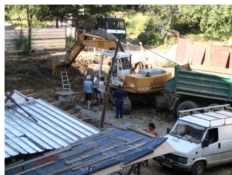
Междублоково пространство, окупирано от тежки строителни машини